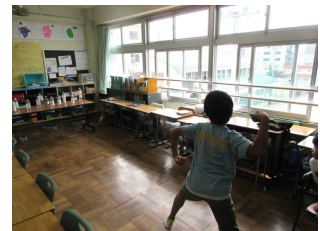
【ストラックアウト】