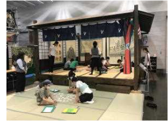
【4年生】金山博物館・防災安全センター 歴史や安全について学びました。 ふじさんミュージアム・レーダードーム館・科学研究所 【6年生】県立博物館 考古博物館 古代の人々の様子を学びました。