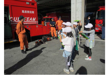
【3年生】製菓工場・消防署 様々に働く人々を学びました。