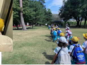
【1・2年生】万力公園 切符を買って、電車に乗りました。