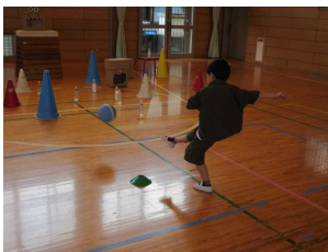
【キックターゲット】